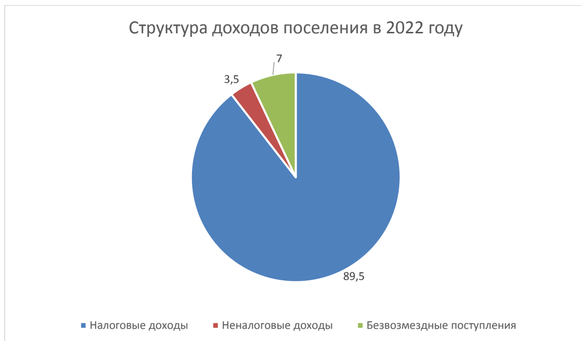
Рис. 1. Структура доходов поселения за 2022 год.

Выполнение плана обеспечено по всем доходным источникам собственных доходов.